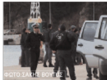
ΦΩΤΟ ΣΑΤΗΡ ΒΟΥΤΣ

Ο Πλοίαρχος αρνήθηκε να συμμορφωθεί προς τις σχετικές εντολές ακινητοποίησης και άφησε την πορεία του, κινούμενος προς το στενό Κεφαλληνίας - Ζακύνθου, με αποτέλεσμα να ακολουθήσει καταδίωξη και να επιτευχθεί η μεταβολή της πορείας του ανωτέρω Φ/Γ, το οποίο, συμμορφούμενο, κατευθύνθηκε προς το λιμένα Πόρου Κεφαλληνίας, όπου και κατέπλευσε ασφαλώς, συνοδευόμενο από τα εν λόγω σκάφη Λ.Σ..