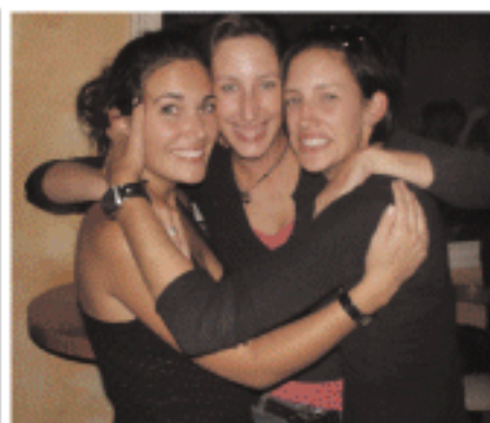
Αδελφές, χάριμα ορθαλμών!!!!