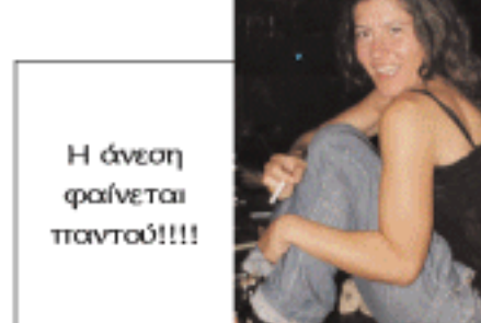
Η άνεση φαίνεται παντού!!!!