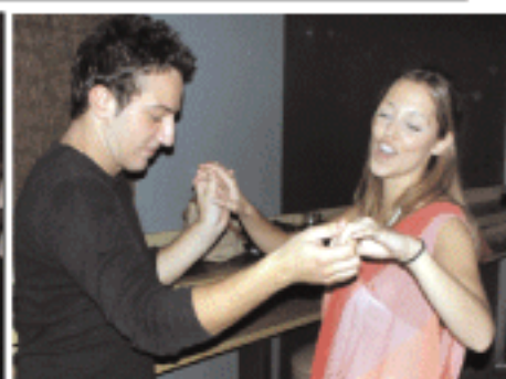
Τοκρετέλι μέχρι πρωιάς!!!