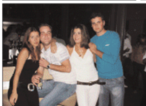
Η Ελένη του RUMOURS με την παρέα της διασκεδάζουν στο BASS!