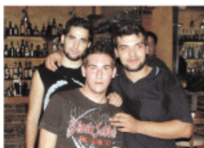
Από μικρά παιδιά μαζί. Αυτό θα πει φιλία!!!!