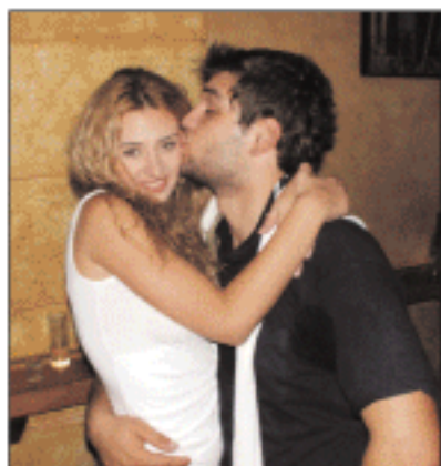
Μη πάει ο νους στο κακό! Φίλοι είναι τα παιδιά!!!