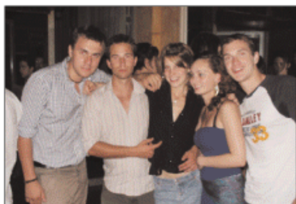
Ξέφρενες βραδιές στο RUMOURS πέρασε η παρέα της φωτό και έπεται συνέχεια....