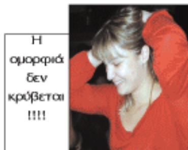
Η ομορφιά δεν κρόβεται !!!!