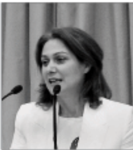
αν δεν λυθεί άμεσα και οριστικά το πρόβλημα ιδιαίτερα ενόψει των εορτών.

Ως Δήμαρχος διαμαρτύρομαι και καταγγέλλω την μέχρι σήμερα ολιγωρία στο συγκεκριμένο ζήτημα τη στιγμή που γίνονται υπέρογκες και δυσβάσταχτες αυξήσεις στους λογαριασμούς της ΔΕΗ και δηλώνω ότι θα προσφύγουμε σε αγωγή