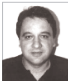
ΚΕΦΑΛΟΝΙΑ - ΥΓΕΙΑ ΩΡΑ ΜΗΔΕΝ

Το Εθνικό Σύστημα Υγείας και το δίκτυο Πρόνοιας στον Νομό μας ασθενεί βαρέως, και αυτό δεν είναι μια σημερινή ανακάλυψη. Όλοι οι φορείς του τόπου μας το έχουν επισημάνει, και το έχουν καταγγείλει επανειλημμένως τους τελευταίους μήνες. Δυστυχώς η κυβέρνηση κωφεύει, και οι τοπικοί παράγοντες της Ν. Δ. προσφεύγουν σε επι-