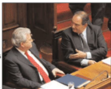
Ο πρωθυπουργός με τον υπουργό Ανάπτυξης στη Βουλή

Ο κ. Αβραμιόπουλος προσέθεσε ότι θα δοθεί τέλος σε φαινόμενα αδιαφάνειας και στο «κατακερματισμένο, αδιάφανο και ανάλειψτο σύστημα» που κληροδοτήθηκε, και πως σύντομα θα διαμορφωθούν οι συνθήκες για ένα λειτουργικότερο σύστημα υγείας. Αναφερόμενος στις προαλήψεις, ο κ. Αβραμιόπουλος τόνισε πως προχωρούν με γρήγορους ρυθμούς και ήδη 6.500 νοσηλεύτες έχουν περάσει το κατώφλι του ΕΣΥ, ενώ τον Σεπτέμβριο θα ολοκληρωθούν και οι προαλήψεις των υπόλοιπων 6.000. Απαντώντας σε ερώτηση σχετι-