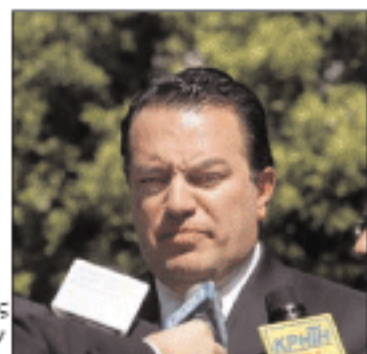
Ο υπουργός Παιδείας Ευριπίδης Στυλιανίδης μετά την Κυβερνητική Επιτροπή για θέματα αρμοδιότητάς του

Η πολιτική φιλοσοφία του νομοσχεδίου αυτού, όπως είπε ο υπουργός Παιδείας, είναι η προώθηση της ανθρώπινης Ελλάδας. Μιας ελληνικής πολιτείας δηλαδή, όπως ανέφερε, που σέβεται με ευαισθησία και ανθρωπιά πάνω στα προβλήματα.