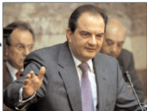
δεσμεύσεις της για την αύξηση του ΕΚΑΣ και του επιδόματος ανεργίας.

Συνεχίζοντας ο πρωθυπουργός ανέφερε ότι θέση και στόχος της κυβέρνησης είναι να εξασφαλίσει δίκαιη και βιώσιμη κοινωνική ασφάλιση. Ανέφερε ότι η κυβέρνηση προχωρά στην καθιέρωση από το 2009 κατώτατης σύνταξης που θα υπερβεί τα όρια της φτώχειας. Επίσης, από το 2008 προχωρεί η χρηματοδότηση του Εθνικού Ταμείου Κοινωνικής Συνοχής, ενώ η κυβέρνηση υλοποιεί τις