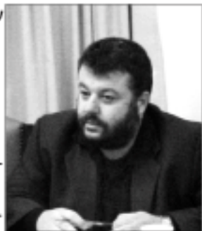
της προκαταρκτικής μελέτης ήταν ομόφωνη.

Όλοι οι σύμβουλοι της αντιπολίτευσης δήλωσαν ότι έχουν πολλές επιφυλάξεις, αλλά τελικά η έγκριση