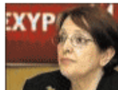
καταδικάζουν την πολιτική και τους στόχους της κυβέρνησης και της ΕΕ.