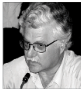
ο οποίος μπορεί και πρέπει να προσφέρει πολλές υπηρεσίες στον μικρό δήμο Πυλαρέων.

υπάλληλο και φοβούμαστε ότι θα κλείσει και αυτό. Απευθυνόμαστε σε κάθε υπεύθυνο και αρμόδιο και ζητάμε να επαναληφθεί ο αστυνομικός σταθμός, ο