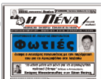
Το σχετικό πρωτοσέλιδο δημοσίευμα της ΠΕΝΑΣ στις 29 Οκτωβρίου

Βεβαίως, το γεγονός ότι ο όρμος της Αγίας Πελαγίας είναι ανοιχτός στους νότιους, νοτιοανατολικούς και νοτιοδυτικούς ανέμους, είναι γνωστό σε όλους τους κατοίκους της περιοχής και ασφαλώς από αυτούς ακριβώς