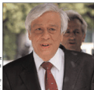
Ο κ. Παυλιόπουλος συναντήθηκε την Πέμπτη με τον πρωθυπουργό

τους αγρότες, αφού σύντομα θα τους επιστραφεί ο φόρος για το πετρέλαιο.